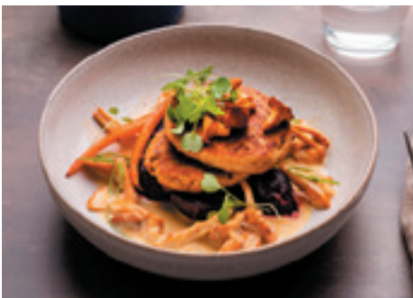
126089 Hätälä Savuinen lohipehvi ME 1,5 kg, dyno 5,90 €/kg (alv 0 %) EAN: 2387905000006

Suurena kala-alan toimijana Hätälän kapasiteetti ja toimitusvarmuus ovat huippuluokkaa, joten voit huoletta tarjota asiakkaillesi pohjoisen rehtiä kalaa!