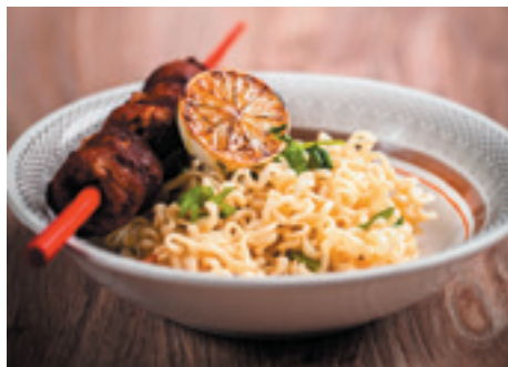
109354 Hätälä Lohipyörykkä ME 5 kg, pakaste 4,59 €/kg (alv 0 %) EAN: 6408790001766