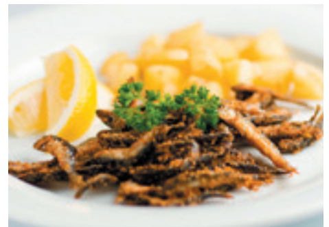
111676 Hätälä Frittimuikku ME 1,5 kg, dyno 10,84 €/kg (alv 0 %) EAN: 2387963500005